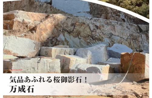
気品あふれる桜御影石! 万成石