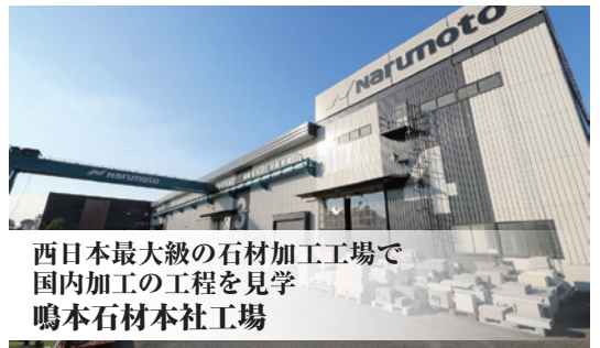
西日本最大級の石材加工工場で 国内加工の工程を見学 鳴本石材本社工場

■旅程 (…は徒歩 =は貸切バス ~は貸切船) 食事: 1日目(昼・夕) 2日目(朝・昼)