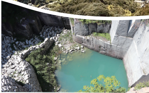
伝統の銘石! 北木石