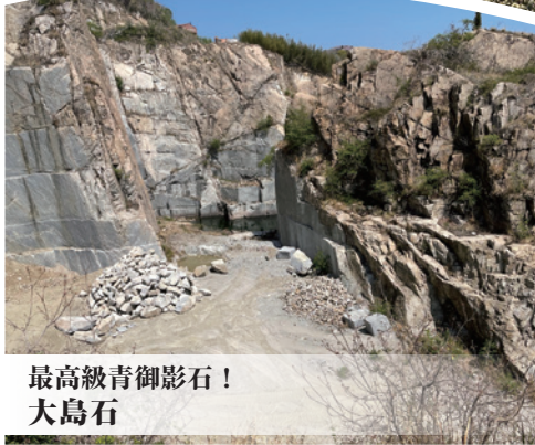
最高級青御影石! 大島石