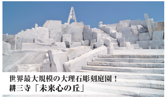
世界最大規模の大理石彫刻庭園! 耕三寺「未来心の丘」