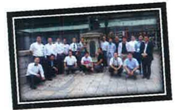
エンディング産業展期間中 現地には台風の影響が…東京銘石ツアーにご参加頂いた皆さま、大変お疲れ様でした。そして、本当にありがとうございました。