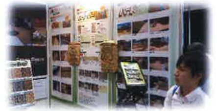
入社2年目 営業 山下君 熱心に見学している様子